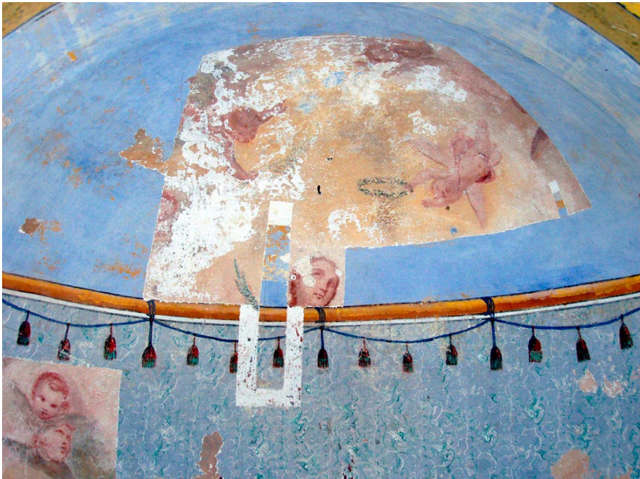
Откривени дјелови Кокољиног сликарства у калоти апсиде