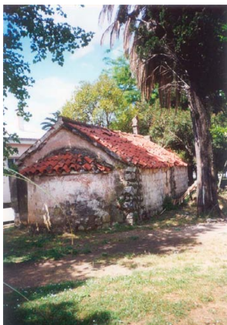
Поглед на цркву св. Неђеље са сјевероистока