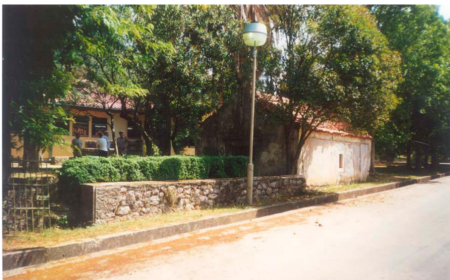
Црква св. Неђеље; поглед са југозапада