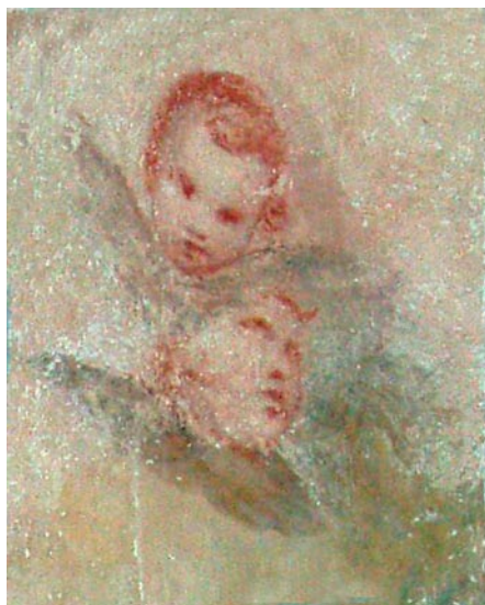
Херувими; детаљ из апсиде