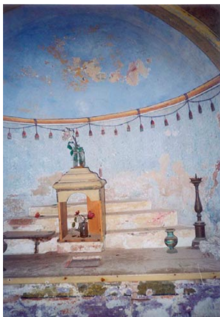
Апсида цркве св. Неђеље; затечено стање