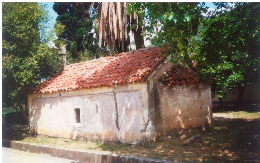
Поглед на цркву св. Неђеље са југоистока