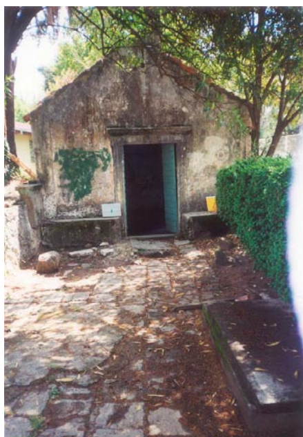
Западни изглед цркве са двориштем