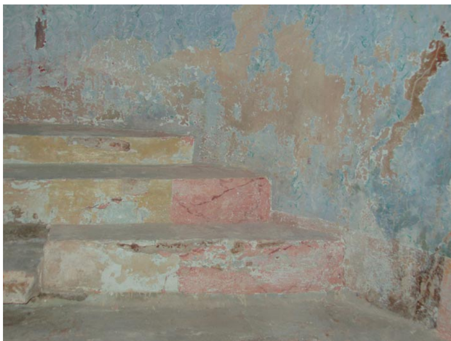
Марморизација степеника у олтарском простору