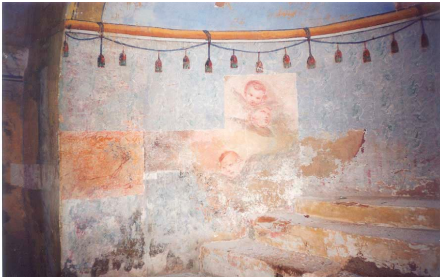
Сјеверна страна апсиде; изглед у току радова на откривању Кокољиног сликарства