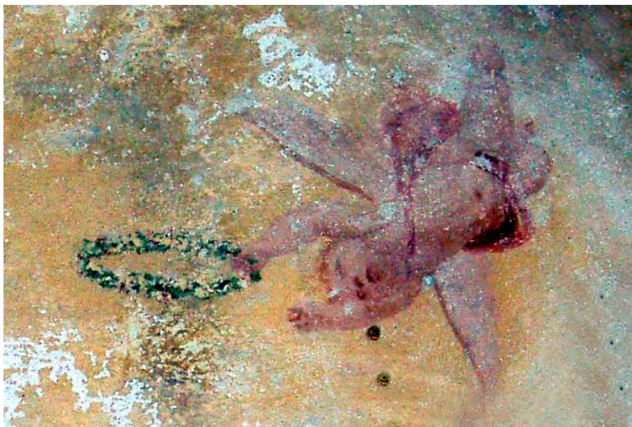
Анђео на јужној страни калоте апсиде