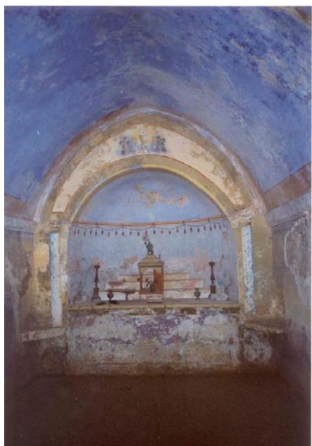
Унутршњост цркве св. Неђеље; затечено стање